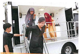
大きな揺れを体験しました足がふらつきます

今回は、試験的な講座でしたが、日本で自然災害が起きた時に、どこへ行けばいいのか、どのようにして身を守ればいいのか、一つ知識が増え良い経験になりました。また、災害時には、外国人も支援される対象から支援する人材として期待されるよう地域との連携が必要であると感じました。