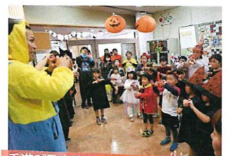
手遊び歌を楽しみました

10月27日(日)田原市民まつりの日に恒例のイベント「英語DEハロウィーン」を開催しました。今年は28人が参加し、午前と午後に分かれて2回行いました。ハロウィーンデコレーションの事務局で、仮装した英語の先生方と一緒にハロウィーンのお話やゲームを英語で楽しみました。その後、子どもたちは、市民まつり会場内を回り「トリック・オア・トリート」と言ってキャンディーをもらいました。ハロウィーンの文化に親しむことが出来ました。