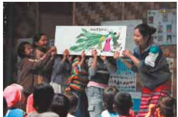
－シャンティホームページより－

※6月26日（土）の20周年を祝う会の会場において、絵本を届ける運動の絵本購入募金をさせていただき多くの方が寄付して下さいました。募金額は26,265円で11冊の絵本を購入させていただきました。ご協力ありがとうございました。