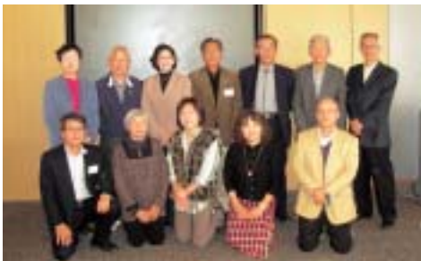
市民海外派遣(中国)参加者の皆さん

来年以降の参加者も随時募集しています。興味のある方はいつでもお問い合わせください。