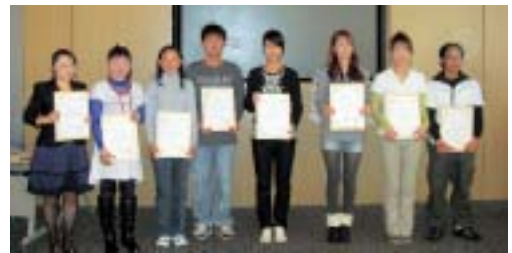
「外国人によるスピーチコンテスト」 出場者の皆さん

このコンテストは、1月に豊川市で開催される「東三河スピーチコンテスト」の出場者の選抜も兼ねており、出場を決めた方は早くから原稿の作成に取り組んでいました。最初は、緊張している様子の出場者も、場の空気に慣れてくると身振り手振りや観客への語りかけなど、自分が言いたいことを前面にアピールしながら発表していました。皆さん甲乙付けがたく、審査は大変でした。