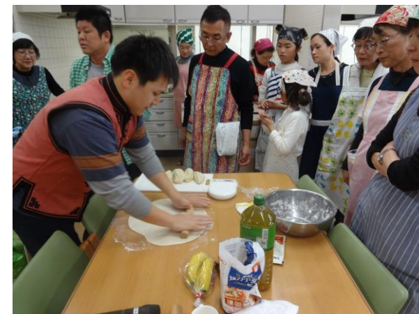
ツオイワン（焼うどん）用の麺を手作で。