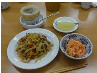
モンゴルの家庭料理；ツオイワン（焼うどん）、シュル（スープ）、人参のサラダ。