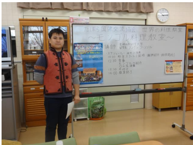
ウランバートル出身の先生。