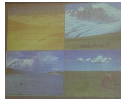
モンゴルの文化と先生のけん玉の腕前も披露していただきました（^^）！